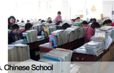
German School vs. Chinese School